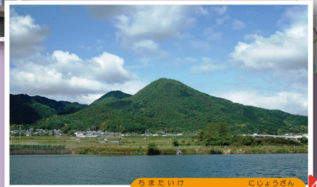
4 ちまたいけ にしよつざん 干股池から望む二上山

専称寺には、市内最古の木造十一面観音菩薩立像や木造阿彌陀如来立像(いずれも香芝市指定文化財)が祀られています。境内には、県の保護樹木にも指定されている「しだれ桜」があり、春になると美しく境内を彩ります。 住所：畑 7-9-7