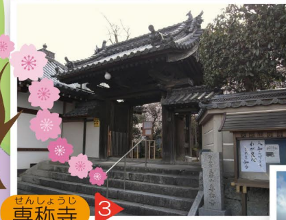
3 せんしょうじ 専称寺

専称寺には、市内最古の木造十一面観音菩薩立像や木造阿彌陀如来立像(いずれも香芝市指定文化財)が祀られています。境内には、県の保護樹木にも指定されている「しだれ桜」があり、春になると美しく境内を彩ります。 住所：畑 7-9-7