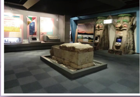
6 かしばにしよつざんはくぶつかん 香芝市二上山博物館

住所：藤山1丁目17-17(ふたかみ文化センター内) TEL 0745-77-1700 開館時間：午前9時～午後5時(入館は午後4時30分まで) 休館日：毎週月曜日 (国民の祝日、振替休日当たる場合は開館、翌平日は休館)、 年末年始(12月28日～1月4日) URL： http://kashiba-mirai.com/