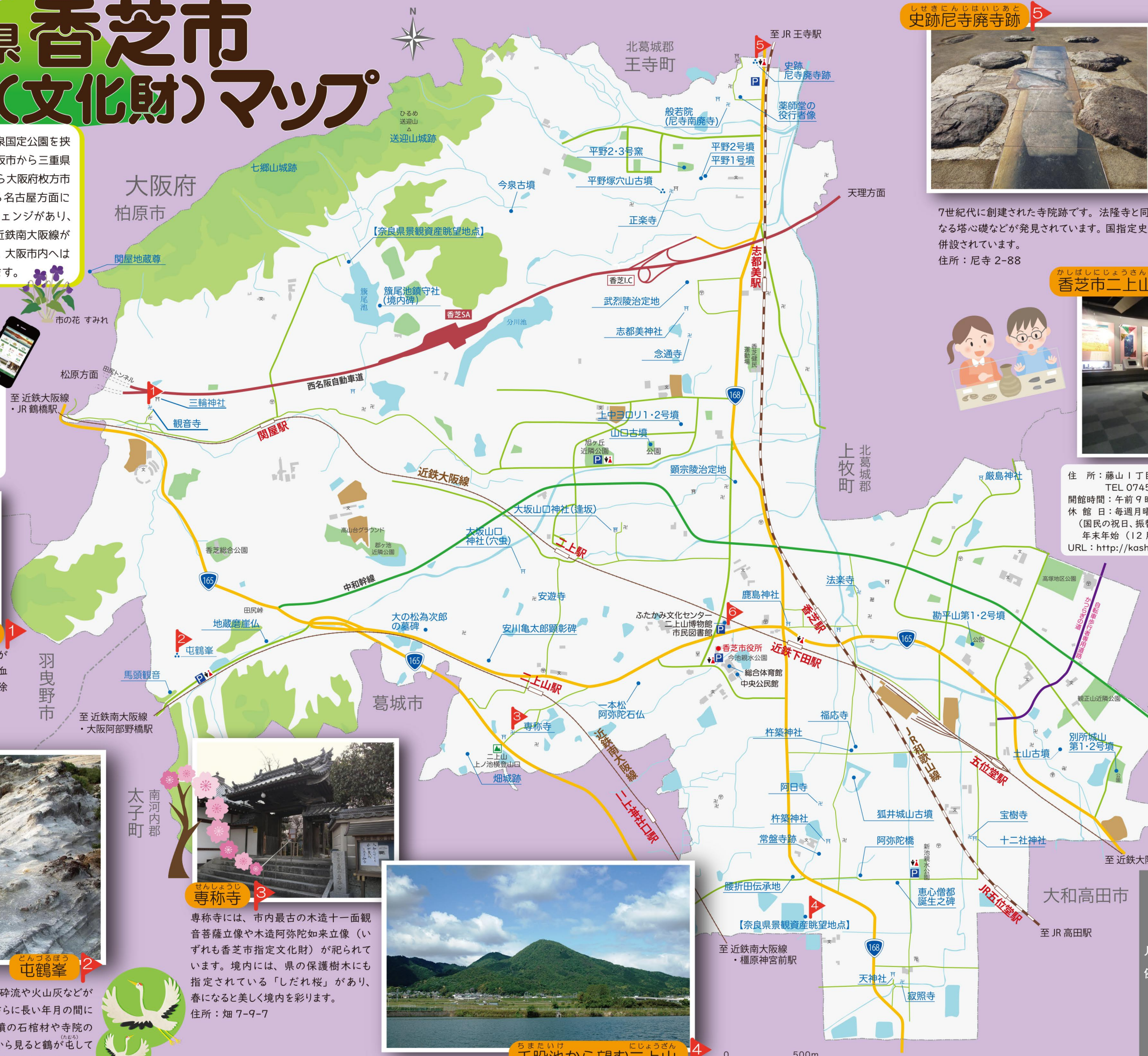
5 しせきにんじほいしあと 史跡尼寺廃寺跡