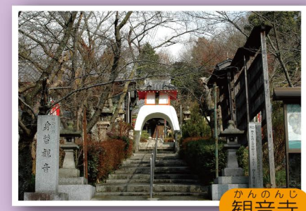
1 かんなんじ 観音寺

本尊の十一面千手観世音菩薩は、楠木正成が戦で敵から矢を受けた際、身代わりになって血を流したと伝えられており、「身替観音」「矢除観音」として親しまれています。 住所：田尻 351